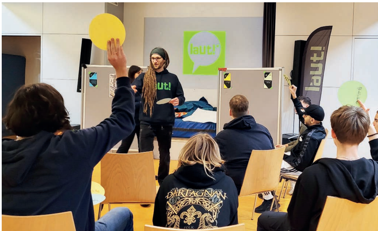
Jugendliche gestalten „ihren“ Kickerkäfig

und Rahmenbedingungen für ein Kinder- und Jugendhaus mit Trendsporthalle beschrieben. Eckpunkte in aller Kürze: große Flächen, gute ÖPNV-Anbindung, Veränderbarkeit und die Möglichkeit, es selbstverwaltet zu nutzen. Daraufhin wurde das Grundstück durch die Stadt gesichert. Im Februar 2025 wurde das Planungsrecht geschaffen.