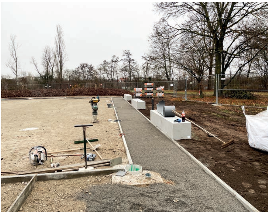
Fundamentarbeiten am Kickerkäfig an der Fürther Straße

Am 06. Februar 2024 kamen im Kinder- und Jugendhaus TetriX alle beteiligten Jugendlichen und Expert*innen aus der Verwaltung zusammen. Gemeinsam wurde bei der Nutzer*innenbeteiligung die konkrete Gestaltung der Fläche besprochen. Bald darauf war die Finanzierung: 60 Prozent Städtebauförderung, 40 Prozent laut!-Pauschale abgestimmt. Im Herbst 2024 waren die Feinheiten geklärt und die Planung stand. Bei der Jubiläumsfeier des TetriX im Juli 2025 beteiligte sich laut! noch bei einer letzten offenen Gestaltungsfrage: Außenbanden