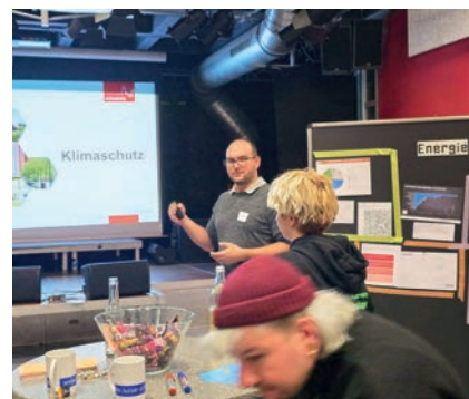
Workshops zum Klimaschutzkonzept

Vorbereitung auf den Internationalen Protesttag zur Gleichstellung von Menschen mit Behinderung. laut! unterstützte bei der Erarbeitung von Forderungen und Plakaten an der Harnbacher Mühle und begleitete die Gruppe am 4. Mai 2024 beim Protestmarsch mit Interviews und Social-Media-Dokumentation. Bei den Vorbereitungen entstand die Forderung nach einer fairen Bezahlung in Werkstätten für Menschen mit Behinderung. Dieses Anliegen brachten sie zum laut! Forum Live 2025, dabei wurden sie fachlich durch einen Vertreter der Noris Inklusion unterstützt. Der Prozess inspirierte Mitglieder der Gruppe sich auch künftig politisch einzumischen, und an den Themen in anderen Gremien/Formaten dranzubleiben.