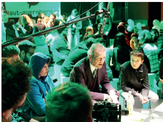
„laut!“ Forum live mit „Gründungs-Oberbürgermeister“ Dr. Ulrich Maly

Seit 15 Jahren leistet das Nürnberger Beteiligungsformat laut! hierzu einen wichtigen Beitrag. Das Modell richtet sich besonders an bildungsferne Jugendliche und Jugendliche aus unterschiedlichen Lebenswelten, die sonst nur schwer Zugang zu politischen Prozessen finden. laut! möchte möglichst viele junge Menschen erreichen und ihnen niedrigschwellige Beteiligungsmöglichkeiten bieten – online, medial und bei Veranstaltungen vor Ort.