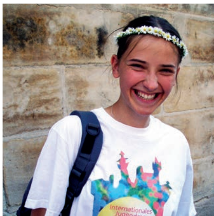
Eine glückliche Teilnehmerin des Internationalen Jugendcamps 2006

80 Jahre – da lohnt sich ein Blick zurück auf die bewegte Geschichte des KJR.