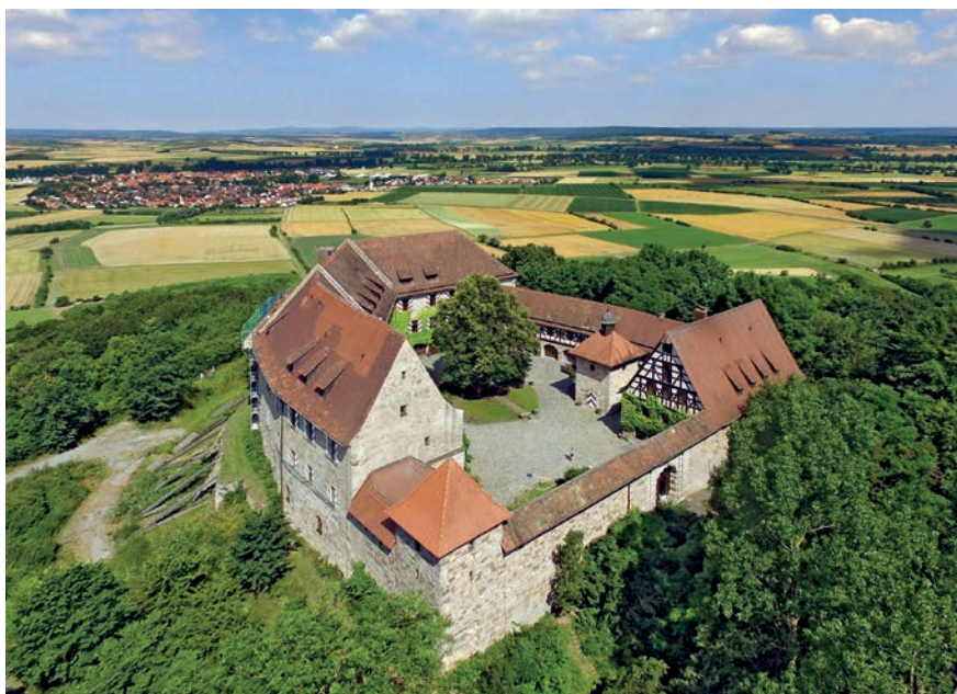
Luftbild der Nürnberger Jugendbildungsstätte Burg Hoheneck

Jugendhilfeausschuss hat erst vor kurzem die Verwaltung aufgefordert, die Planungen für die Weiterentwicklung der Burg einzuleiten. Dazu gehören ein Erweiterungsbau sowie der Einbau eines Aufzugs, um die Burg zumindest teilweise barrierefrei zu machen. Aus der Politik gibt es derzeit von allen Seiten Rückenwind – bleibt zu hoffen, dass es nicht bei Versprechen bleibt, sondern wirklich Geld in die Hand genommen wird.