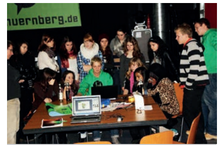
Jugendliche in der Luise beraten sich

In den Sesseln der Stadträt*innen ein gemeinsames Projekt entwickeln, mit einer Rallye durchs Rathaus dösen und spielerisch eine Menge über Kommunalpolitik lernen – das geht, in vier Stunden beim „Lernort Rathaus“. Das Format entstand in Kooperation zwischen laut!, DoKuPäd, dem