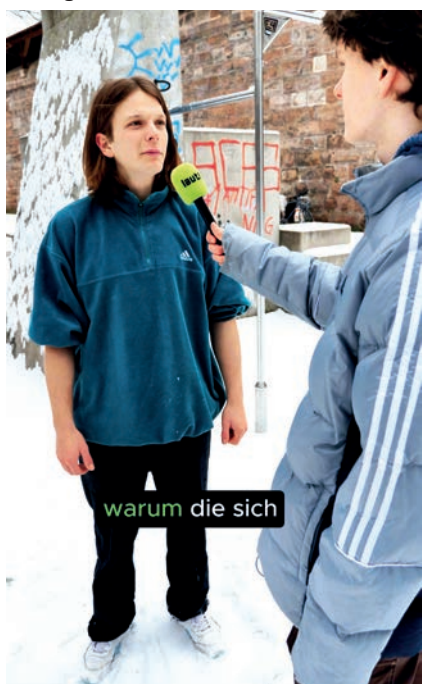
Erstellung eines Social Media Beitrags

Information, Unterhaltung und politische Beteiligung. Diese Plattformen ermöglichen jungen Menschen nicht nur rezeptiven Konsum, sondern auch aktive Mitgestaltung durch Kommentieren, Teilen oder eigene Beiträge.