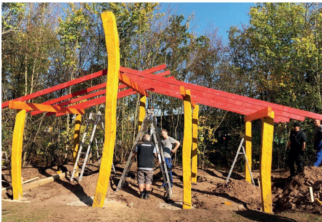
Jugendliche und Künstler gestalteten gemeinsam einen Unterstand 2019

junge Stimmen in Quartiersentwicklungsprozesse in der Südstadt und in Langwasser einzuspeisen. Anfang 2025 organisierte laut! gemeinsam mit den Klimaschutzbeauftragten der Stadt Veranstaltungen zum neuen Klimaschutzkonzept – Forderungen junger Menschen flossen direkt in die Vorlage für den Stadtrat ein. Im Herbst 2025 ergänzte laut! die Überarbeitung des integrierten Stadtentwicklungskonzepts Altstadt (INSEK) um Perspektiven junger Menschen. Dabei beteiligten sich 163 Jugendliche. Alle Ergebnisse aus solchen Kooperationen werden ebenso wie an die Kooperationspartner auch auf der laut! Homepage transparent veröffentlicht.