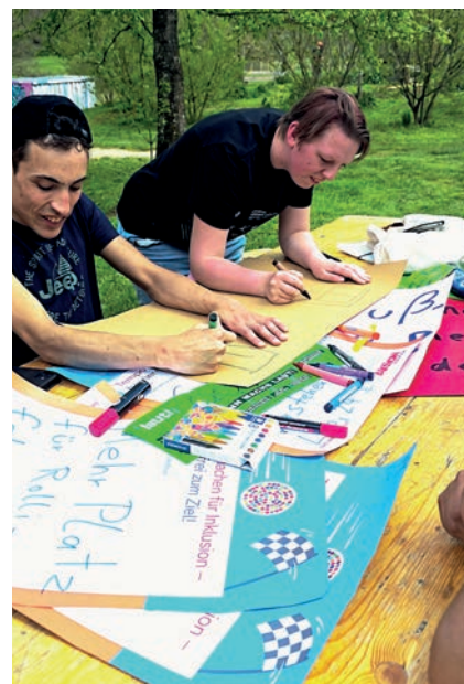
Plakate gestalten an der Harnbacher Mühle

2023 ging laut! gezielt auf Jugendgruppen der Offenen Behindertenarbeit zu. Über das Stadtteilhaus Leo entstand der Kontakt zur Mühlenbande, einer inklusiven Freizeitgruppe im Verein Mühlenkraft e.V. Ihr Anliegen war kein bauliches, sondern ein politisches. Sie wünschten sich Unterstützung bei der