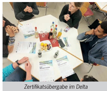
Zertifikatsübergabe im Delta

wir selbst Einfluss nehmen? Ergänzt wird das Programm durch Einblicke in die Arbeit des KJR-Vorstands sowie in Einrichtungen der Offenen Kinder- und Jugendarbeit – überall dort, wo Beteiligung und Mitbestimmung konkret werden.