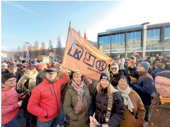
KJR Mitarbeitende auf der Großkundgebung der Allianz gegen Rechtsextremismus

Diese Werte sind keine kurzfristige Positionierung, sondern fester Bestandteil unserer pädagogischen Arbeit und tief verankert